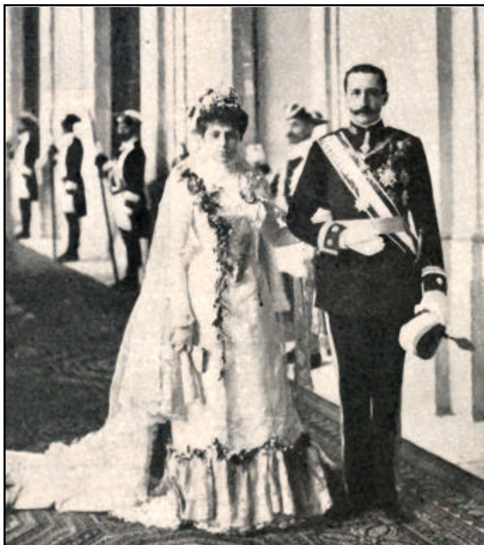
La fotografía oficial del nuevo matrimonio en la galería de Palacio.